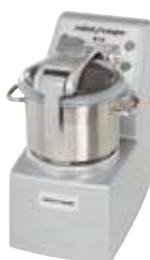
R 10 - R 10 V.V.