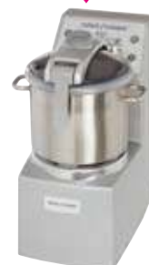
R 20 - R 20 V.V.