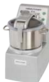
R 15 - R 15 V.V.