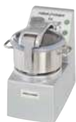
R 8 - R 8 V.V.