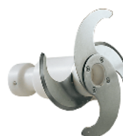
Shaft with knives for pesto sauce