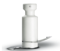
Shaft with knives to mix dough