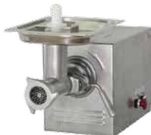
комплект ножей – полный унгер