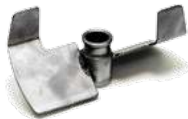
1. Ротор лопастной