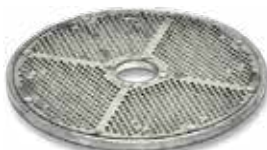
2. Диск протирочный, Ø ячейки 3 мм