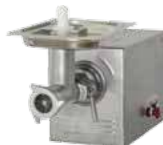
комплект ножей – полный унгер