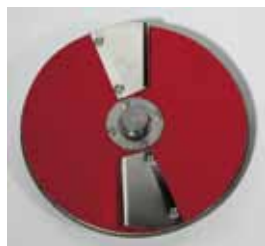
рабочий вращающийся диск