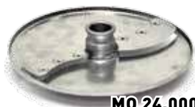
3. Нож дисковый 10 мм

Используются только в комплекте, предназначены для протирания вареных овощей и фруктов для приготовления пюре, творога, каш для диетического питания.