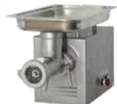
комплект ножей – полный унгер