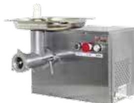
комплект ножей – полный унгер