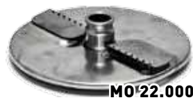
8. Нож комбинированный 10x10 мм

Предназначен для шинковки капусты, нарезки кольцами и полукольцами репчатого лука, нарезки кружочками (ломтиками) толщиной 2 мм сырых овощей (картофель, морковь, свекла, репа, огурцы свежие, брюква и др.) для приготовления салатов, супов, запеканок, квашения капусты и др.