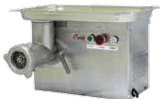
комплект ножей – полный унгер