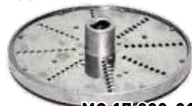
5. Диск шинковочный

Используются только в комплекте, предназначены для нарезки кубиками сечением 10x12x12 мм сырых овощей (картофель, морковь) и вареных овощей (картофель, морковь, свекла) для приготовления салатов, винегретов, супов и др.