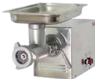
комплект ножей – полный унгер