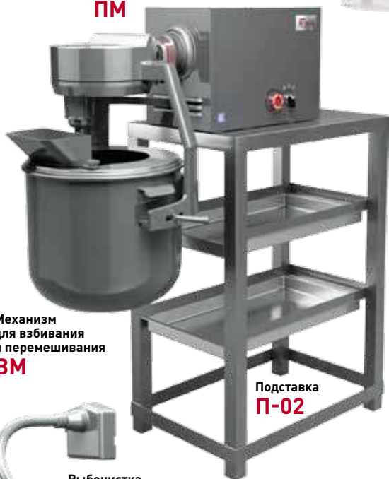
Механизм для взбивания и перемешивания ВМ