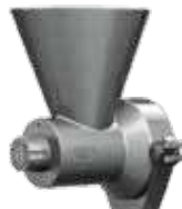
Механизм для измельчения сухарей и специй МИ