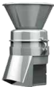
Механизм протирачный МО-02