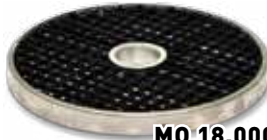
4. Решетка ножевая 12x12 мм