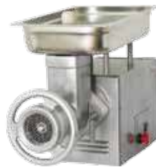
комплект ножей – полный унгер

Мясорубки М-50С, М-80М, М-300М, М-400 и М-600 оснащены зубчатым цилиндрическим редуктором. Они имеют более высокий ресурс работы деталей редуктора.