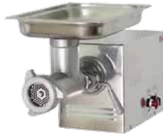
комплект ножей – полный унгер