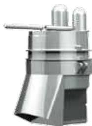
Механизм овощерезательный МО-01