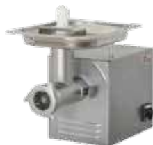
комплект ножей – полуунгер