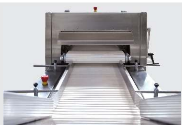
Подающий и прижимной транспортеры

Предназначены для резки различных сортов и форм хлеба, хлебобулочных изделий на предприятиях хлебопекарной промышленности.