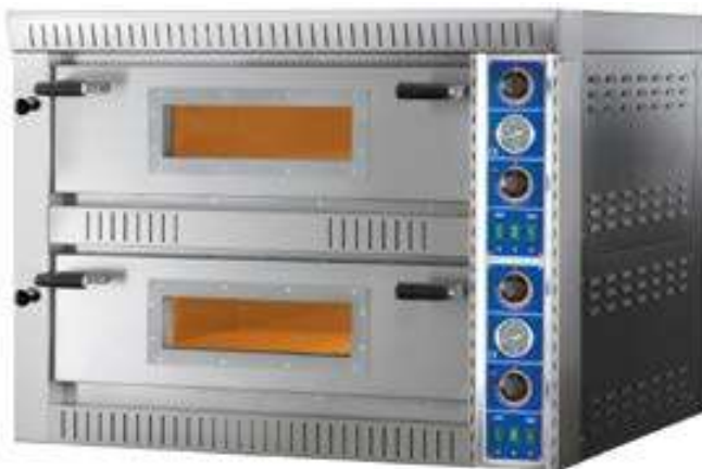
SB 4+4 | SB 6+6