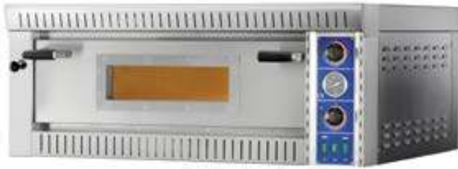
SB 4 | SB 6

electric pizza oven four électrique à pizza horno para pizzería