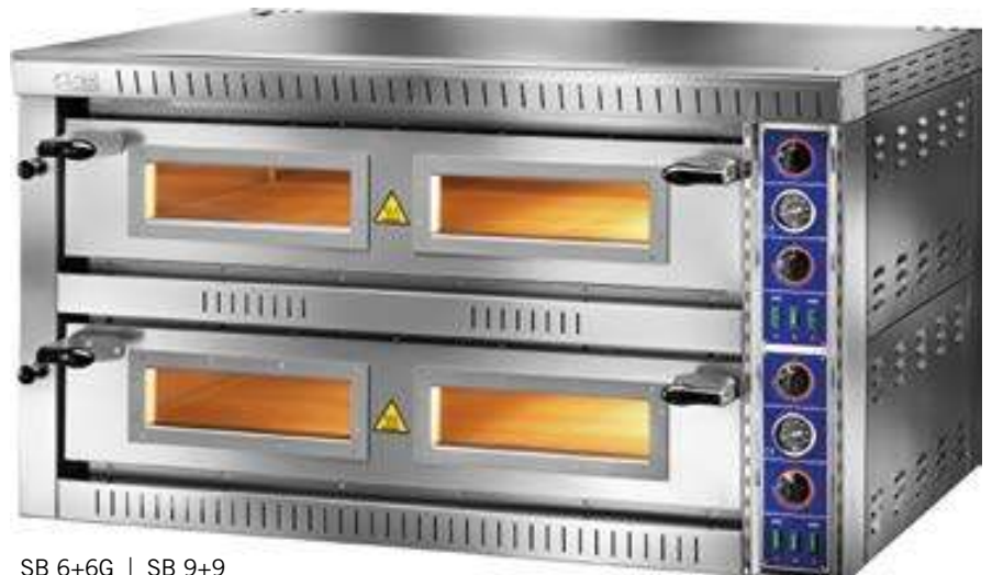
SB 6+6G | SB 9+9